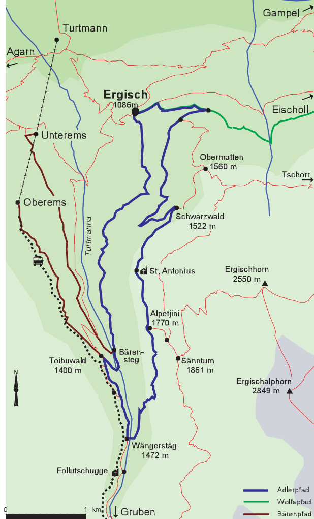
Ergisch: Ausgangspunkt zur Rundwanderung